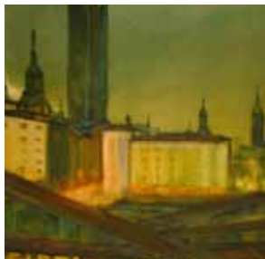
Boris Sachakov „Leipzig Nacht“, 1980